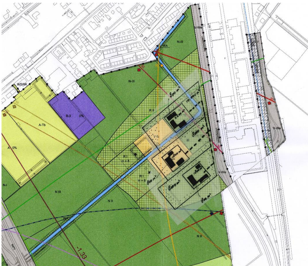
Figuur: Situatieschets nieuwe ligging recreatief concentratiepunt over de ligging, zoals die in het ontwerpbestemmingsplan was geregeld.

Het recreatief concentratiepunt wordt kleinschaliger dan voorheen is voorgesteld en zal bestaan uit drie percelen met een bebouwingsfootprint van 800 m 2 per perceel. De (verharde) erven hebben een oppervlakte van 1.800-2.200 m 2 waarop kan worden geparkeerd en de percelen hebben een oppervlakte van 8.000 tot 10.000 m 2 . Deze oppervlakten en maten zijn tot stand gekomen door een maat en schaal vergelijking met de bebouwing in het lint van de Rodenrijseweg en de oppervlakten voor groenprogramma's, zoals een kinderboerderij en kleinschalige horeca als uitgangspunt te nemen.